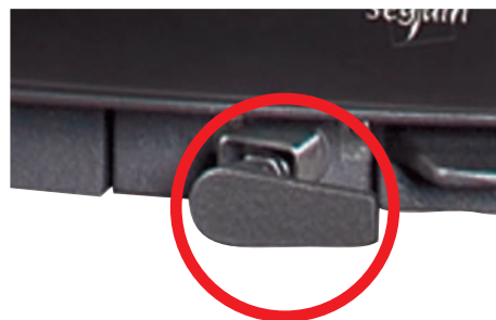
Manetka regulacji dopływu powietrza

OPCJA dostępna dla wkładów wyposażonych w system DAFS